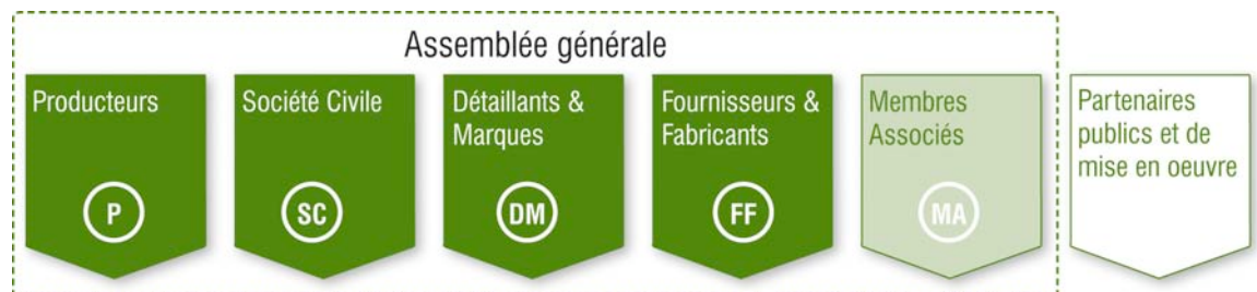
Figure 1: Catégories de membres et partenaires

Les membres souhaitant mettre fin à leur adhésion doivent donner un préavis de six mois par écrit adressé au Conseil de la BCI. La cotisation pour l'année en cours n'est pas remboursable.